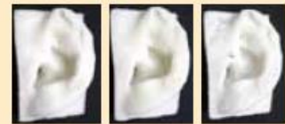
3Dプリンタで「印刷」した耳介