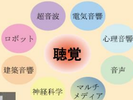
研究室の守備範囲