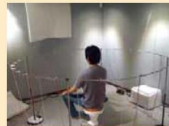
頭部伝達関数の高速計測システム