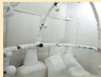
音像定位実験用スピーカアレイ