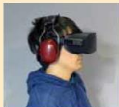
Oculus Rift を用いた動的視聴覚ディスプレイ