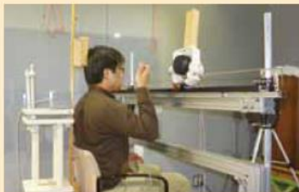
移動音知覚の実験装置