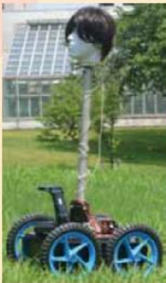
モバイル・テレヘッド