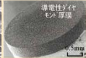
導電性ダイヤモンド 小径軸付砥石

机上放電ツルーイング法はダイヤモンド砥石先端部を微細に成形し、マイクロ形状の研削加工を可能とします。また、近年開発された導電性ダイヤモンドは、マイクロ流路金型やマイクロレンズ金型等の加工に用いられる微小砥石への適用が期待されます。